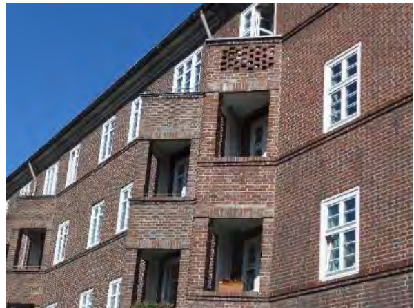
Abb. 15: Balkone in Im Winkel