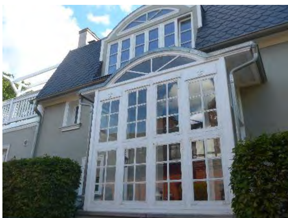
Abb. 11: Prägende Originalfenster mit Sprossen