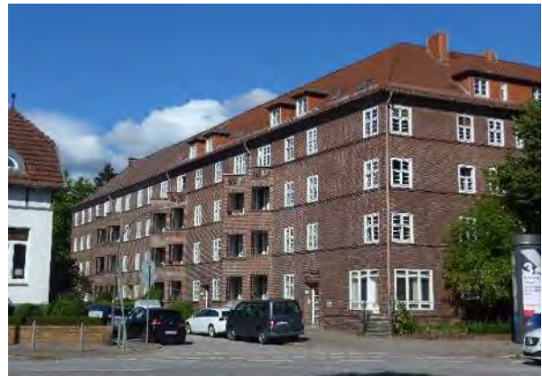
Abb. 4: Backsteinbau in Im Winkel