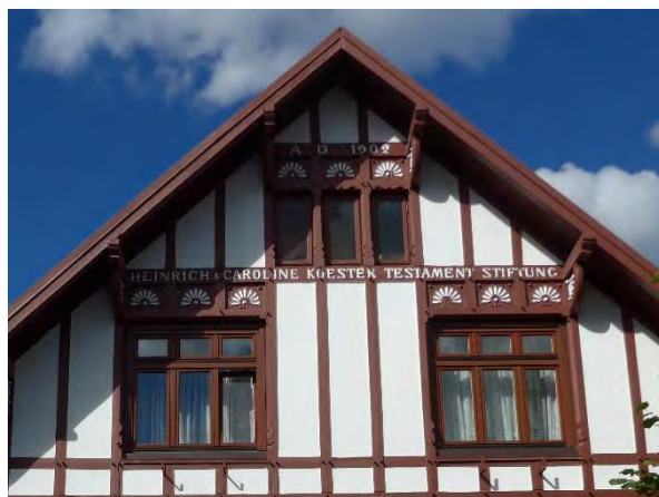
Abb. 16: Fachwerkgiebel mit Inschrift