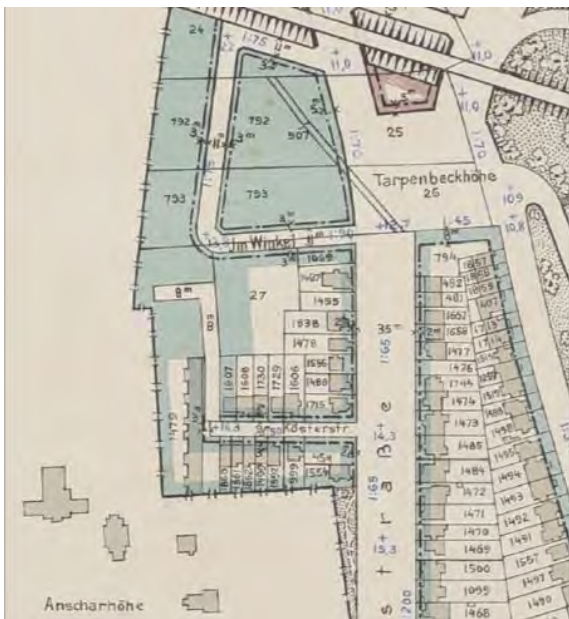
Abb. 13: Bebauungsplan Eppendorf von 1908

Die Bebauung entwickelte sich zunächst um den alten Dorfkern bei St. Johannis herum, sowie im Bereich der Ludolfstraße und der Eppendorfer Landstraße. Der größte Entwicklungsschub erfolgte in der Zeit der Industrialisierung zwischen 1890 und dem Ersten Weltkrieg. In dieser Zeit vervierfachte sich die Bevölkerung und wuchs bis 1920 auf 84.000 Einwohner. 2 In der Zeit gab es infolge des großen Bevölkerungswachstums gesteigerte Bauaktivitäten, die Grundstücke wurden immer höher und dichter bebaut.