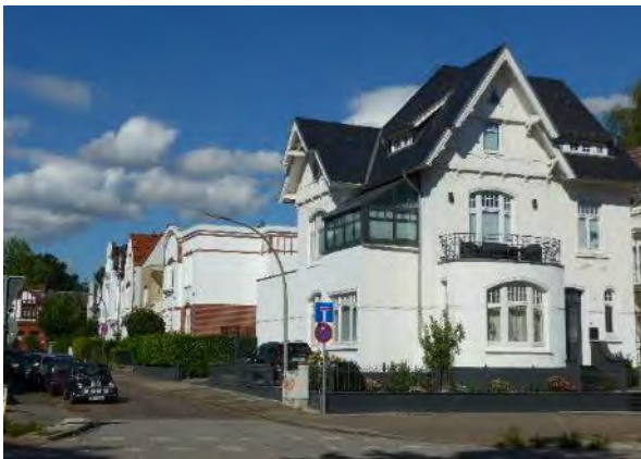
Abb. 3: Jugendstilvilla in der Kösterstraße

Für die Zukunft besteht weiterhin ein erheblicher Veränderungsdruck durch anstehende Modernisierungs- und Sanierungsbedarfe sowie dem Bedarf an einer stärkeren Ausnutzung der Grundstücke durch Anbauten und den Ausbau von Dachgeschossen. Hinzu kommen Planungen, die das bestehende Ensemble durch den Abriss einzelner stadtbildprägender Gebäude bedrohen. Hierdurch wären der Gebäudebestand und das Erscheinungsbild des Quartiers im Ganzen gefährdet. Ein funktionales Thema ist die Umgestaltung der prägenden Vorgartenbereiche zugunsten von Fahrradabstellanlagen und für die Müllaufbewahrung, auch Kfz-Stellplätze werden hier teils integriert. Das ursprüngliche Bild des Erhaltungsgebietes droht durch diese Aspekte überformt zu werden. Das Augenmerk liegt dabei nicht nur auf den