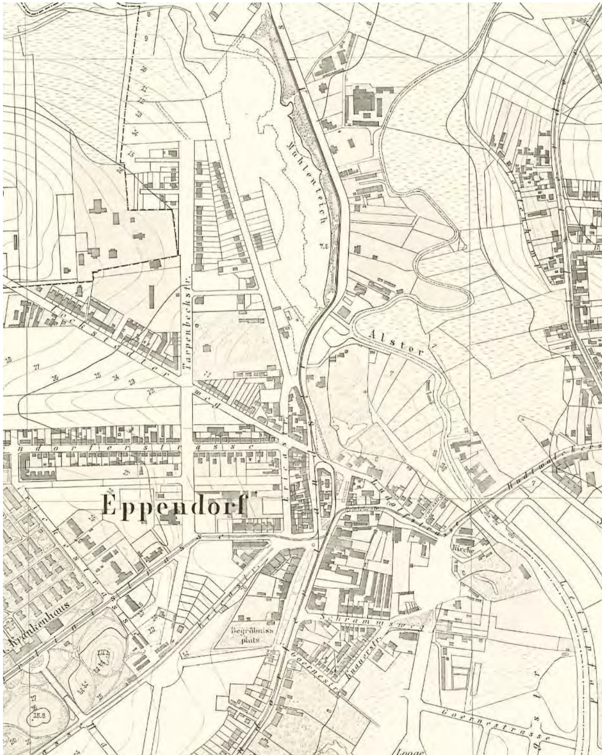
Abb. 2: Hamburg 1904 (Ausschnitt) – das spätere Straßenraster ist in Teilen bereits vorhanden; einzelne Stadthäuser bzw. Villen im Bereich Kösterstraße/ Im Winkel sind schon erkennbar.