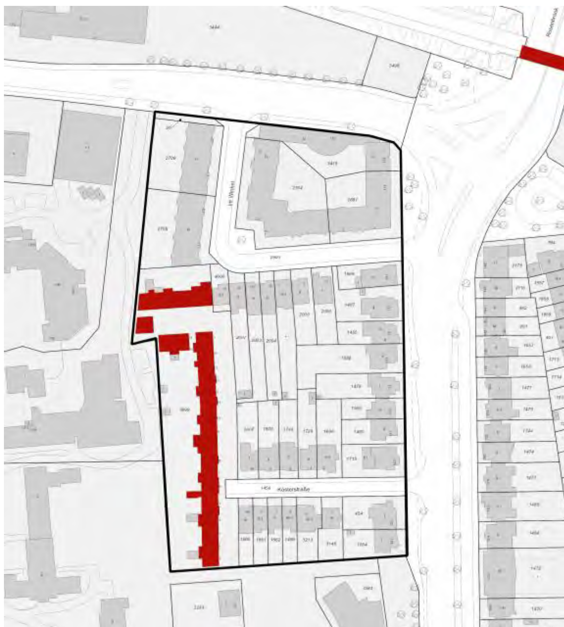
Abb. 7: Übersichtskarte der Baudenkmale

Kösterstraße 11, Haus 11-1, 11-2, 11-3, 11-4, 11-5, 11-6, 11-7, 11-8, 11-9, 11-10, 11-11, 11-12, 11-13, 11-14, 11-15, 11-16, 11-17, 11-17a, 11-17b, 11-17c, 11-18, 11-19, 11-20, 11-21, 11-22, 11-23