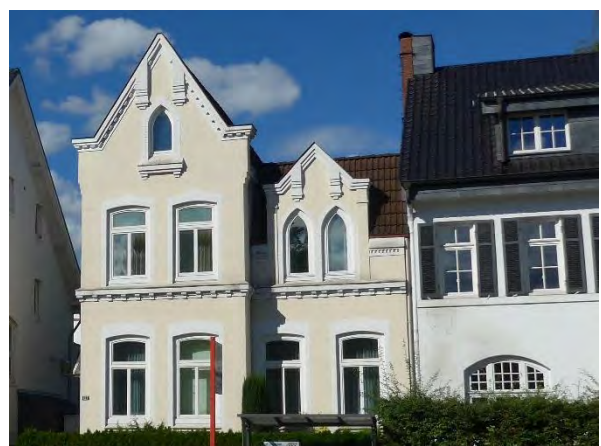
Abb. 17: Bebauung Tarpenbekstraße