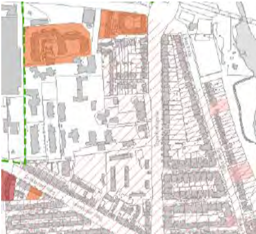
Abb. 8: Auszug Backsteinkartierung (Behörde für Stadtentwicklung und Wohnen, 2014)

Durch die Novellierung der Hamburgischen Bauordnung (HBauO) vom 14. Dezember 2005 (HmbGVBl. S. 525, 563), zuletzt geändert am 20. Februar 2020 (HmbGVBl. S. 148, 155), im Speziellen dem § 60 HBauO – Verfahrensfreie Vorhaben – der Anlage 2 zur HBauO und dem § 61 HBauO – Vereinfachtes Verfahren – ist die Beteiligung der Verwaltung nicht mehr vorgesehen. Bauherren steht es frei, Fenster und Türen eigenverantwortlich austauschen, Dachgauben und Dacheinschnitte herzustellen sowie Außenwandverkleidungen oder Wärmedämmverbundsysteme an Gebäuden bis zu 7m Höhe antragsfrei zu installieren.