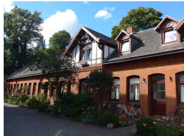
Abb. 6: Gebäude der Köster Stiftung