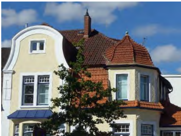
Abb. 14: Eckgebäude Kösterstraße