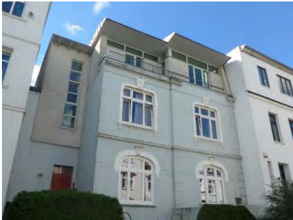
Abb. 9: Dachausbau eines Stadthauses

Die Städtebauliche Erhaltungsverordnung stellt einen Eingriff in die privaten Belange der Grundstückseigentümer, insbesondere Artikel 14 Abs. 1 des Grundgesetzes für die Bundesrepublik Deutschland in der im BGBl. Teil III, Gliederungsnummer 100-1 veröffentlichten Fassung, zuletzt geändert durch Art. 1 u. 2 Satz 2 des Gesetzes vom 29. September 2020 (BGBl. I S. 2048) dar. Dieser ist hier vertretbar, da ein hinreichend starkes öffentliches Interesse an der Einführung des Genehmigungsvorbehalts und der Möglichkeit der Verhinderung des Rückbaus, der Änderung, der Nutzungsänderung und der Errichtung baulicher Anlagen besteht. Nur mit dem Instrument der Städtebaulichen Erhaltungsverordnung kann in diesem Gebiet der Bestand mit seiner bauhistorischen und städtebaulichen Qualität erhalten und vor negativen gestalterischen Entwicklungen geschützt werden.