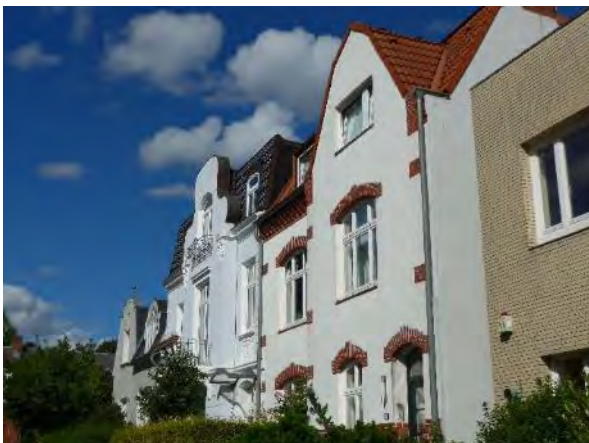
Abb. 5: Stadthäuser im Jugendstil