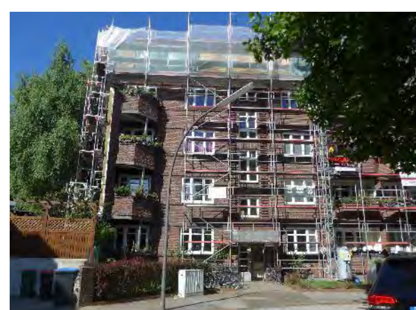
Abb. 12: Aktuelle Fassadensanierung