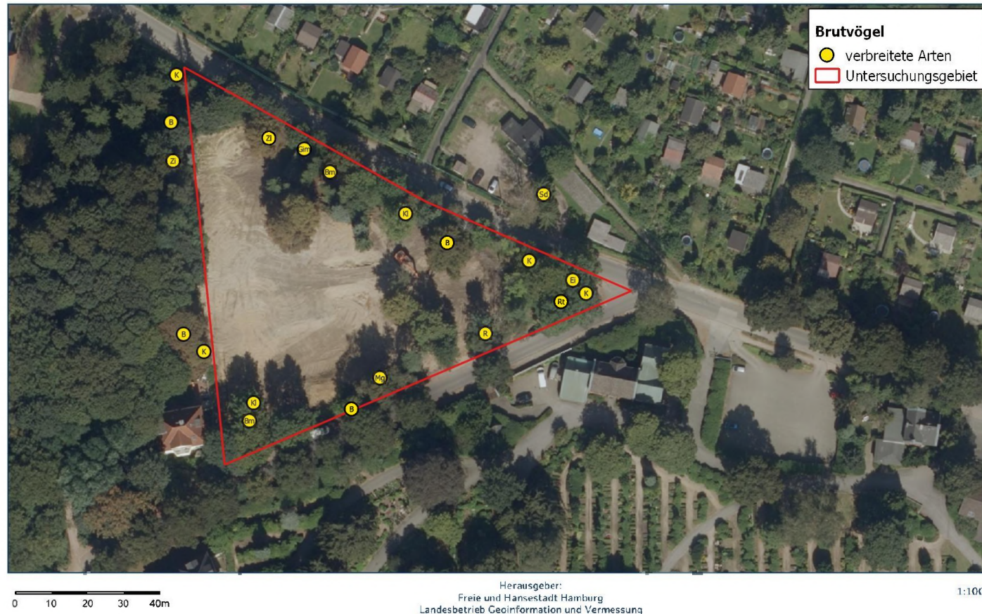
Abbildung 6: Ermittelte Brutreviere; B = Buchfink, Bm = Blaumeise, Ei = Eichelhäher, Gim = Gimpel, K = Kohlmeise, Kl = Kleiber, Mg = Mönchsgrasmücke, R = Rotkehlchen, Rt = Ringeltaube, Sd = Singdrossel, Zi = Zilzalp

████████████████████ Dorfstr. 96, 24598 Heidmühlen, Tel.: 0151206355 ████████ e-mail: ████████@fledermaus-gutachten.de