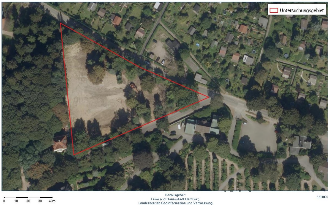
Abbildung 1: Untersuchungsgebiet; nördlich Von Hutten Straße, Hamburg