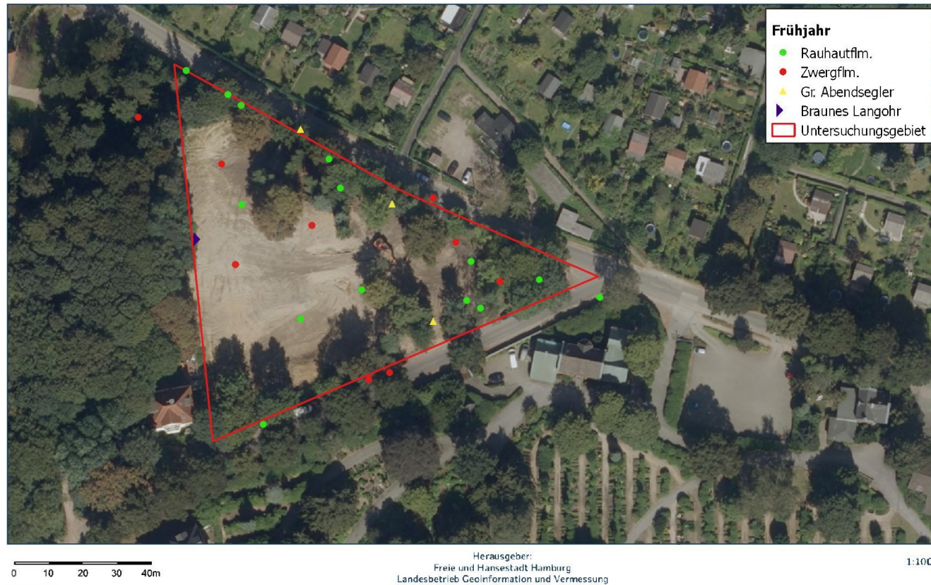
Abbildung 3: Fledermausortungen während der Detektorbegehung zur Frühjahrszugzeit

████████████████████ Dorfstr. 96, 24598 Heidmühlen, Tel.: 0151206355 ████████ e-mail: ████████@fledermaus-gutachten.de