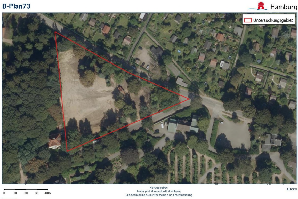
Abbildung 1: Untersuchungsgebiet; nördlich Von Hutten Straße, Hamburg

Für den vorhabenbezogenen Bebauungsplan Bahrenfeld 73 in Hamburg wurden in 2019 Bestandserfassungen hinsichtlich dort möglicher artenschutzrechtlich relevanter Arten sowie die Erstellung eines artenschutzrechtlichen Fachbeitrags durchgeführt (LEUPOLT 2019). Es erfolgten Brutvogelerfassungen durch frühmorgendliche Begehungen von April bis August 2019 sowie Fledermausbestandserfassungen durch Detektorbegehungen im Oktober 2018 und April bis August 2019. Das Untersuchungsgebiet bestand aus dem Vorhabengebiet und besitzt eine Größe von ca. 0,6 ha (siehe Abbildung 1). Die Erfassung nachtaktiver Brutvögel erfolgte parallel mit den Fledermauserfassungen. Des Weiteren wurde das Potenzial für weitere artenschutzrechtlich relevante Arten (hier Amphibien, Reptilien, Haselmaus, baumbewohnende Käferarten sowie Nachtkerzenschwärmer) eingeschätzt. Die Futterpflanzen der Raupe des Nachtkerzenschwärmers wurden parallel zu den Brutvogel- und nächtlichen Detektorbegehungen auf einen aktuellen Besatz hin abgesucht.