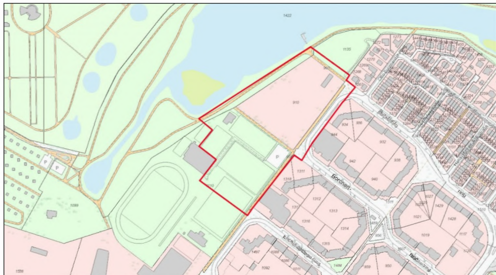
Abb.01: Karte gem. ALKIS-Express (farbig), Grundkarte: http://geoportal-hamburg.de , Freie und Hansestadt Hamburg, Landesbetrieb Geoinformation und Vermessung