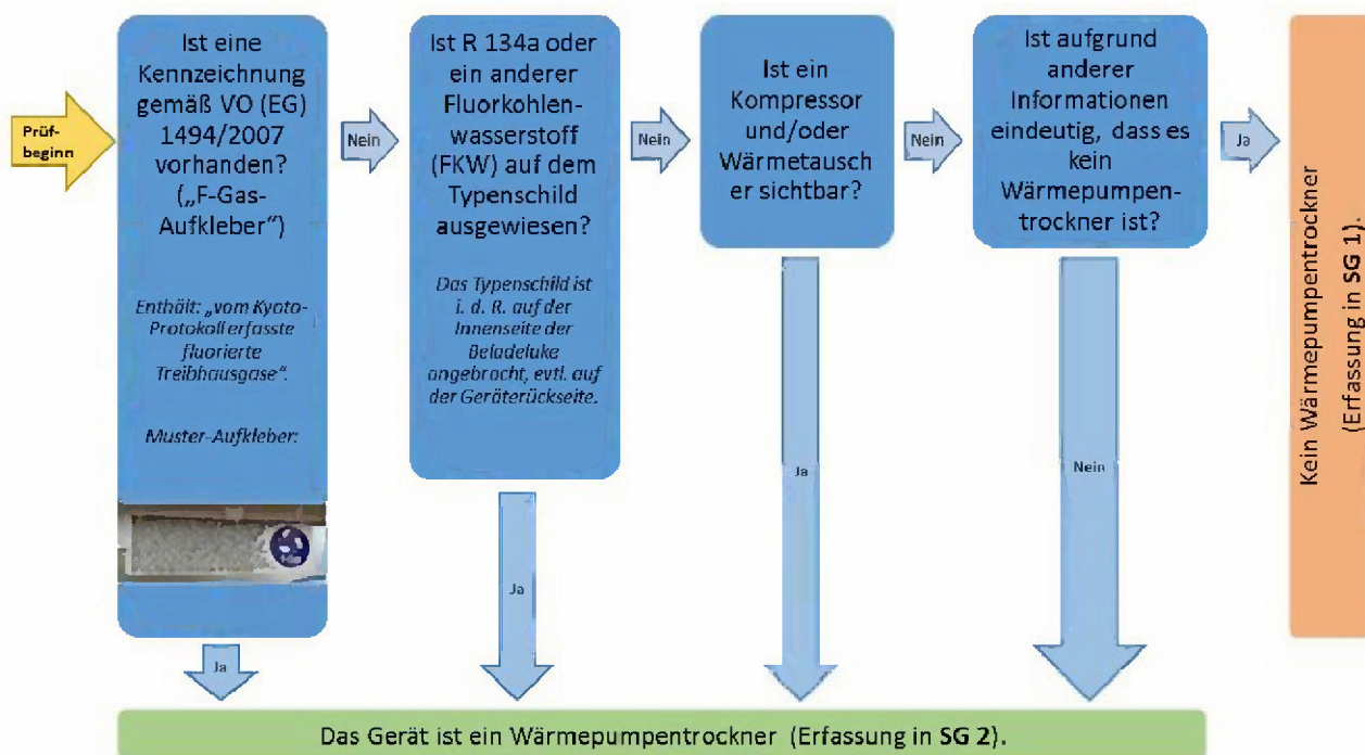
Abbildung 2.1: Identifikation von Wärmepumpentrocknern (Prüfkaskade)