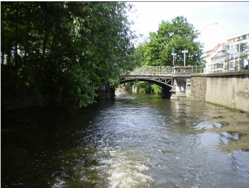
Abbildung 2: Gewässerabschnitte auf der Außenalster Ost - Feenteich (oben: Feenteich, unten: Hofwegkanal)

Die Einstufung einer Art innerhalb der ökologischen Gilden erfolgte gemäß des Arbeitsblattes „Charakterisierung der Fließgewässer-Fischarten Deutschlands“, das sich in dem von DUBLING & BLANK (2004) publizierten fischbasierten Bewertungsverfahren für Fließgewässer (fiBS, Version vom 22.12.05) findet.